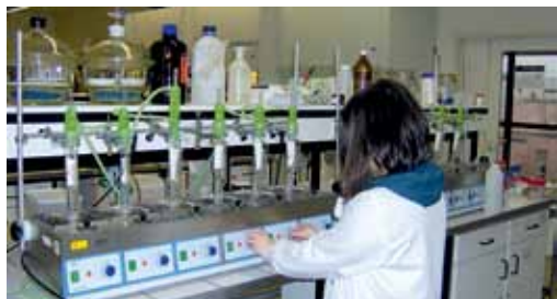
Em laboratório, analisámos a composição para avaliar o interesse nutricional

Medimos o peso líquido e determinámos as misturas de carnes por análise do ADN, confrontando os resultados obtidos com a rotulagem. Os teores de humidade, proteína, gordura e cinza revelam a composição. Determinámos ainda os ácidos gordos saturados e o sódio, que convertimos em sal. Análises microbiológicas permitiram avaliar a conservação e a higiene. Por fim, 50 provedores pronunciaram-se sobre o aspeto, o odor, a textura e o sabor das alheiras.